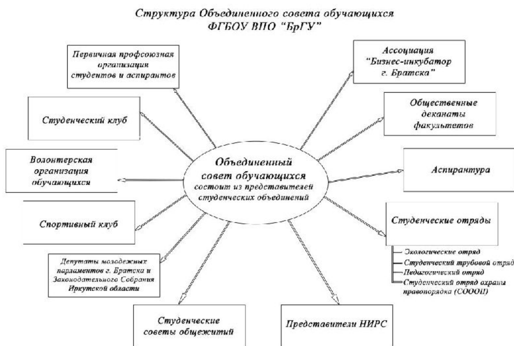
Рис. 1. Структура объединенного Совета обучающихся ФГБОУ ВПО «БрГУ»

Объединенный Совет обучающихся ФГБОУ ВПО «БрГУ» является постоянно действующим представительным-исполнительным и координирующим органом студенческого самоуправления. Совет возглавляется председателем, избранными из числа членов Совета в установленном порядке (рис.1).