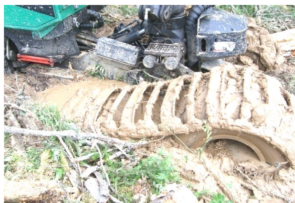
Рис. 5. Заглубление колесного движителя лесной машины, оснащенного моногоусеницей, в слабонесущий (переувлажненный) почвогрунт

ем специальных колесных гусениц (моногоусениц), но этого далеко не всегда бывает достаточно (рис. 5).