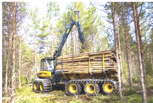
Рис. 6. 10-колесный форвардер Ponsse Buffalo 10W , оснащенный моногоусеницами (опорная площадь 6,05\text{ м}^2 )

В этой связи, одним из вариантов решения проблемы может быть использование лесных машин, не только оснащенных моногоусеницами, но и с большим количеством колес, например, десятиколесных форвардеров (рис. 6). Поскольку давление на почвогрунт 8-колесного форвардера на 50 % больше под нагрузкой, чем давление 10-колесного [26; 27].