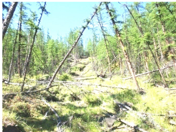
Рис. 2. Оползень на склоне в лесу криолитозоны

фонда, представляется весьма незначительной, но при этом, ввиду достаточно экстремальных климатических характеристик, удельная экологическая нагрузка на вырубленный лесной участок и примвыкающие к нему может оказываться чрезмерной, и приводить к деградации — замедлению или полному прекращению лесовосстановительных процессов [21].