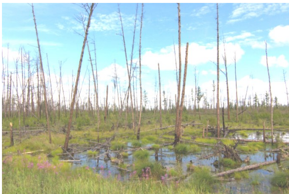
Рис. 3. Результат процесса заболачивания лесного участка на вечной мерзлоте

Конечно, вынос поверхностного мелкозема приводит к активизации процесса почвообразования — выветриванию и образованию новых слоев почвообразующих пород, но это также приводит к нарушению темпов почвообразования и характера сопряжения горизонтов почвогрунтов. А главное — резкому снижению их плодородия. Ведь биологический круговорот в лесах криолитозоны характеризуется как сильно заторможенный. И доказательство этому — активное накопление лесных горючих материалов при общей невысокой продуктивности лесов [25].