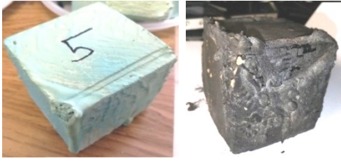
Рис. 1. Образец 5

После испытания: время начала обугливания 1:40 мин, время начала тления 2:20 мин, время возгорания 19:02 мин, температура испытания 300 °С, изменение цвета — черный, масса после испытания 30,6 г.