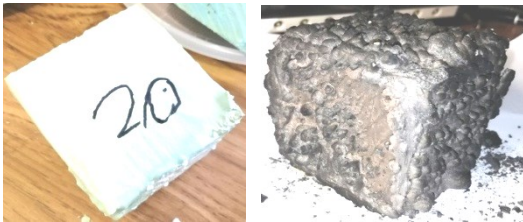
Рис. 2. Образец 6

Согласно рис. 4, наилучшую огнезащиту показали образцы под номерами 1; 8; 10; 15; 19, сопротивлявшихся огню более 11 мин. Наихудшим оказался образец 4, который начал гореть на 7-й мин.