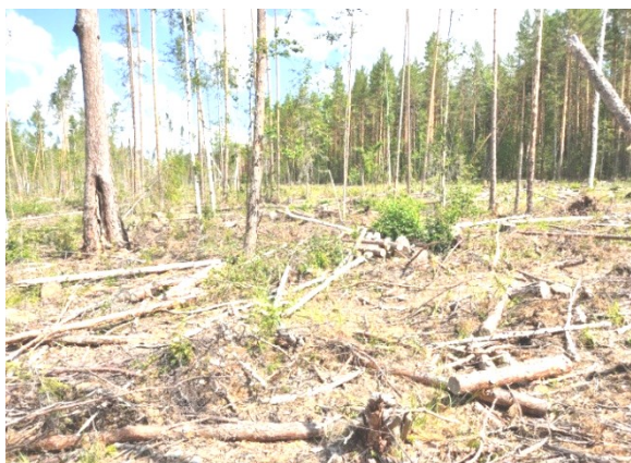
Рис. 1. Вырубка в Иркутской области