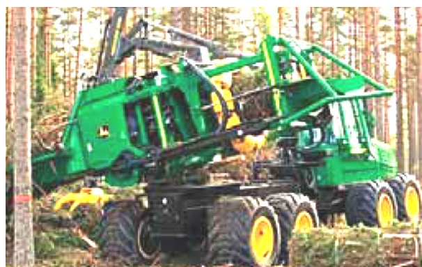
Рис. 4. Пакетирующий модуль Fiberpac на базе John Deere 1490D

В этой связи формулируется задача обоснования оптимальных параметров установки для групповой раскряжевки пакетов (пачек) порубочных остатков, включающих круглые лесоматериалы диаметром 10 см и более.