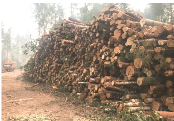
Рис. 2. Штабель вершинных обрезков на погрузочном пункте в Республике Саха (Якутия)

Но при скандинавской технологии заготовки древесины, в отличие от канадской технологии, концентрация крупных порубочных остатков в штабеле — редкость. Поскольку, если вывозить их в дальнейшем не планируется, то их сбор и трелевка при современных, очень либеральных требованиях к очистке лесосек является для лесозаготовителей лишней тратой времени и горючего. На большей части изученных вырубок крупные порубочные остатки и часть кроны оставляются вперемешку [12] (рис. 3).