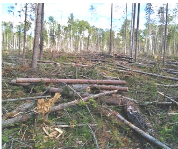
Рис. 3. Вырубка, покрытая вперемешку крупными (стволовыми) порубочными остатками и частями кроны (Красноярский край)

Но при скандинавской технологии заготовки древесины, в отличие от канадской технологии, концентрация крупных порубочных остатков в штабеле — редкость. Поскольку, если вывозить их в дальнейшем не планируется, то их сбор и трелевка при современных, очень либеральных требованиях к очистке лесосек является для лесозаготовителей лишней тратой времени и горючего. На большей части изученных вырубок крупные порубочные остатки и часть кроны оставляются вперемешку [12] (рис. 3).