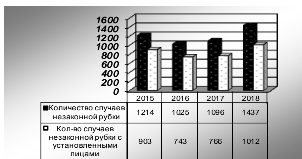
Рис. 4. Случаи нарушения режима лесопользования

На рис. 4 приведены данные о количестве зафиксированных случаев нарушений режима лесопользования на территории Приангарья.