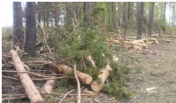
Рис. 2. Результаты освоения лесосеки в ходе незаконной рубки на территории Иркутской области

Леса в Иркутской области занимают 71,5 млн га, или 92 % ее территории. Лесистость области составляет 82,6 %. Земли лесного фонда занимают 69,4 млн га. Общий запас древесины Иркутской области оценивается в 8,8 млрд м 3 , в том числе запас хвойных насаждений — 7,5 млрд м 3 .