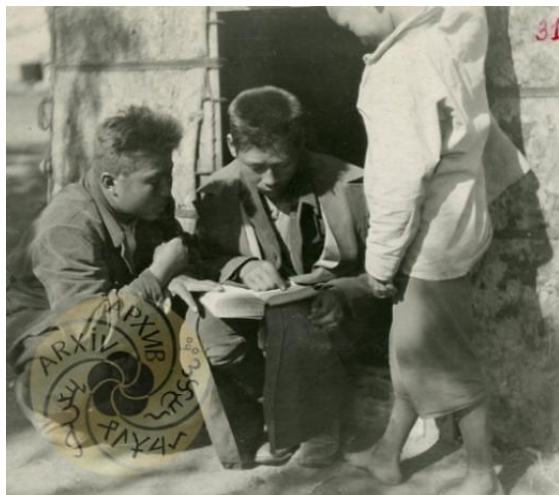
Рис. 4. Массовое распространение грамотности

ко один класс начальной школы, действительно становится учителем: мы в самом деле стали обучать аратов. И они, старшие, называли нас "башки" – учитель. Когда к тебе обращаются со словом "башки", нет более восхитительного чувства. Я испытал его, будучи мальчиком-пионером. Это чувство не покидает меня, взрослого человека, и поныне. Учитель – это слово по значимости в жизни человека можно сравнить разве что со словом "мама"» [15].