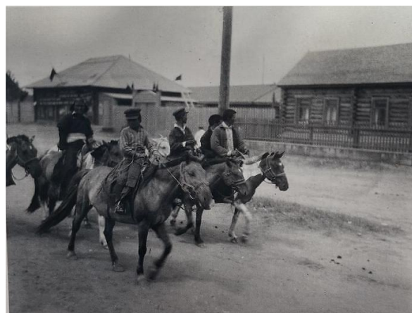
Рис. 3. Школьники из отдалённых районов едут на учебу в интернат. 1936 г.

мало и охватить обучением всех детей они не могли. В 1934 г. только 15,5 % пионеров обучались в школах, в 1937 г. – 47 % [13, ф. 1, оп. 2, д. 33, л. 37]. Для обучения детей аратов письму и чтению на родном языке пионеры создавали свои кружки, руководили ими грамотные ревсомольцы и пионеры. Таких кружков в 1934 г. было 52, в 1937 г. уже 140, а в 1939 г. было создано 267 кружков, в которых занималось 2012 пионеров и 2446 детей, не состоящих в пионерских организациях [13, ф. 1, оп. 2, д. 33, л. 38].