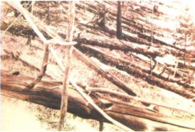
Рис. 1. Вывал леса на месте падения метеорита

Через год, в 1928 г., Л.А. Кулик приехал в тайгу с новой большой экспедицией. В течение лета были проведены топографические съемки окрестностей и поваленных деревьев, а также предпринята попытка откачать воду из воронок самодельным насосом. После чего некоторые из них были разрыты и обследованы. Однако никаких следов метеорита найдено не было.