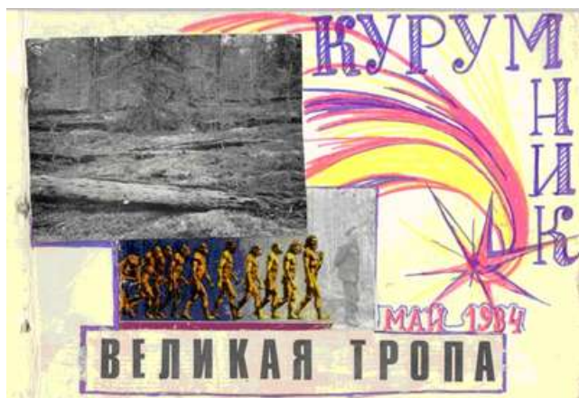
Рис. 6. «Курумник». Май 1994 г.

щейся вокруг предстоящей экспедиции в район Тунгусской катастрофы.