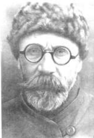
Рис. 2. Л.А. Кулик. 1929 г.

Третья экспедиция Л.А. Кулика, состоявшаяся в 1929–1930 гг., была самой многочисленной и оснащенной оборудованием, в частности, насосами для осушения воронок и буровой установкой. В ходе работ была вскрыта одна из наиболее крупных воронок, однако, как показали исследования, воронки имели не метеоритное, а термокарстовое происхождение, т. е. были образованы во впадине в результате таяния вечной мерзлоты, богатой льдом. Таким образом, и в этой экспедиции Л.А. Кулик (на снимке) не нашел никаких следов метеорита.