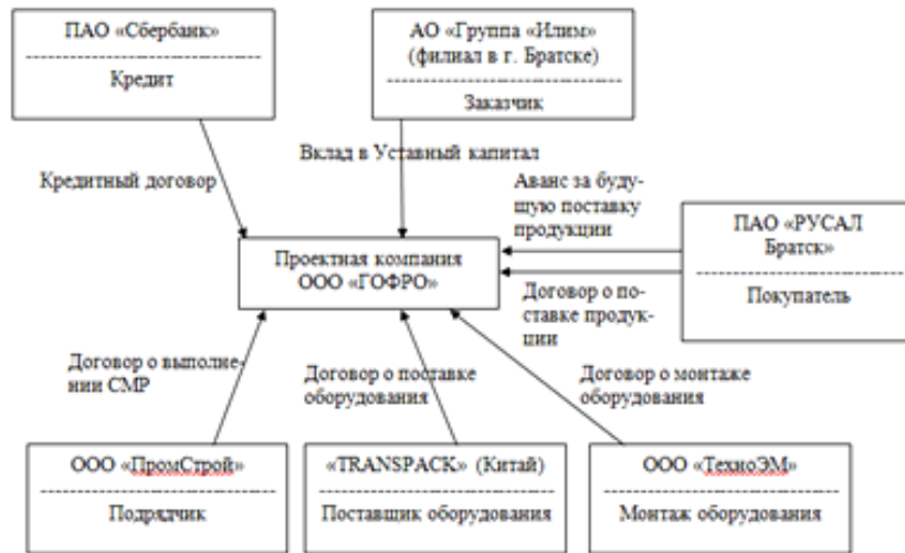
Рис. 1. Схема проектного финансирования инвестиционного проекта по производству гофрокартона

На рисунке 1 представлена разработанная схема проектного финансирования инвестиционного проекта по производству гофропродукции.