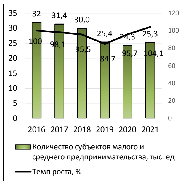
Рис. 1. Количество субъектов МСП в Забайкальском крае, тыс. ед. [1]

Если рассматривать фактическую ситуацию с развитием малого и среднего предпринимательства в Забайкальском крае, то она выглядит уже несколько лет неоднозначно.