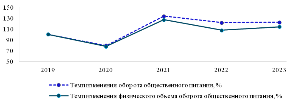
Рис. 1. Темпы изменения оборота общественного питания в Российской Федерации за 2019-2023 гг. (цепной способ), %.

продаж за период 2019–2023 гг., а не только влияние инфляционного роста цен на прирост объема продаж в общественном питании (рис. 1).