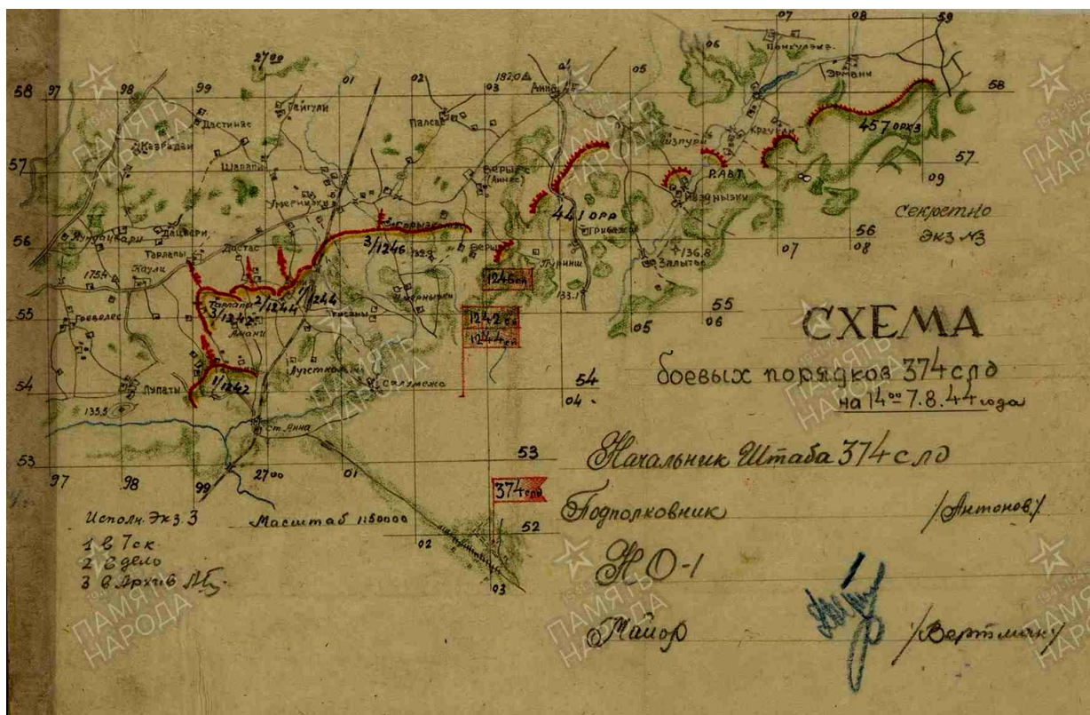
Рис. 2. Схема боевых порядков 374-й дивизии на 14.00 7 августа 1944 г.