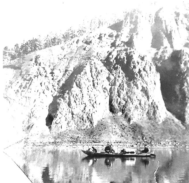
Рис. 5. По Ангаре

биях ЗИС-5 привезли в Братский район, в д. Пьяново. Лошадей привели из ближайших колхозов, которых Соболев попросил беречь. Отряд довел просеку до Усть-Кута и 23 июня 1941 г. был расформирован, большинство его участников ушло на фронт» [12; 13].