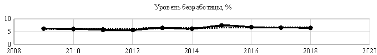
Рис. 3. Уровень безработицы в Республике Крым за 2009–2018 гг. [1]

что на 0,1 % ниже уровня безработицы в 2017 г. На рынке труда республики зафиксирована значительная дифференциация уровня регистрируемой безработицы, свидетельствующая в большей степени о социальном, трудовом и экономическом развитии региона. Среди уровней зарегистрированной безработицы можно отметить, что наивысший уровень данного показателя составил 2,1 % в Раздольненском районе, немного ниже (1,8 %) в Нижнегорском районе, а самый невысокий уровень зарегистрированной безработицы зафиксирован в Симферополе (0,1 %).