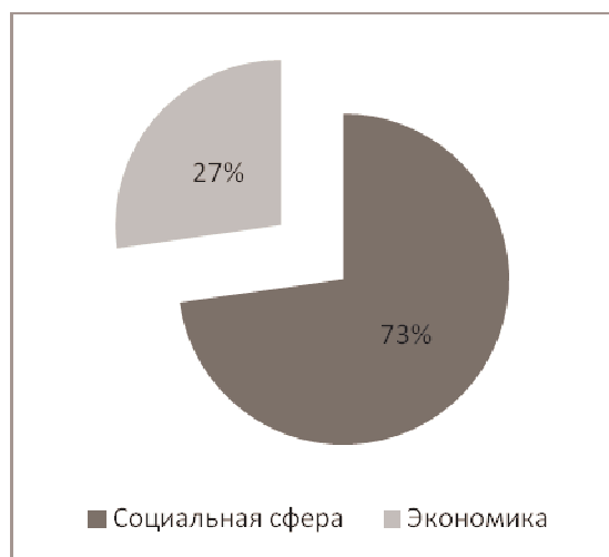
Рис. 2. Тематическая структура ДП

самый малочисленный по количеству публикаций, но за последние годы появились интересные работы о развитии предпринимательства, этнотуризма, участия КМНС в освоении недр, что, очевидно, в дальнейшем привлечет значительный интерес исследователей и отразится на количестве опубликованных работ.