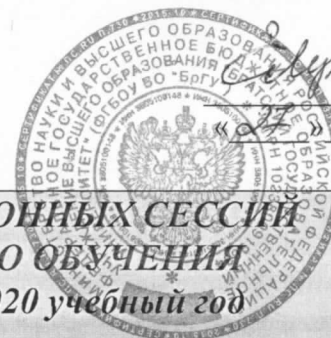
ГРАФИК УСТАНОВОЧНЫХ И ЭКЗАМЕНАЦИОННЫХ СЕССИЙ ФАКУЛЬТЕТА ЗАОЧНОГО И УСКОРЕННОГО ОБУЧЕНИЯ для обучающихся по заочной форме на 2019-2020 учебный год