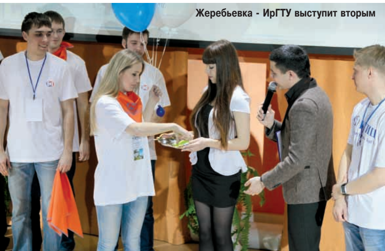
Жеребьевка - ИрГТУ выступит вторым

Маргарита ИСАКОВА Фотографии отдела ТСО, сделанные на открытии конкурса