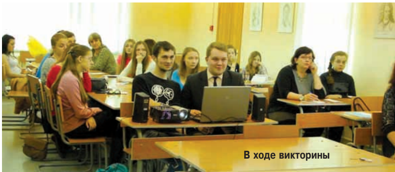
В ходе викторины

В конце мероприятия каждый желающий смог примерить магистерскую мантию и представить себя в роли выпускника нашего вуза, а также получить маленькие сувениры с символикой факультета и свидетельства об участии в Дне открытых дверей. Важно, что сами студенты в теплой, практически домашней обстановке сумели показать будущим абитуриентам, как это здорово учиться там, где тебя любят, уважают твоё мнение, и твоя точка зрения интересна педагогам.